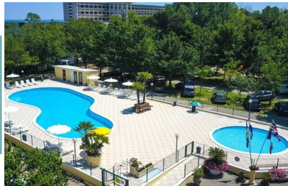
campeggio Piomboni a Marina di Ravenna campeggio Romagna a Milano Marittima